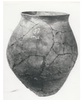
Urn uit grafveld de Hamert